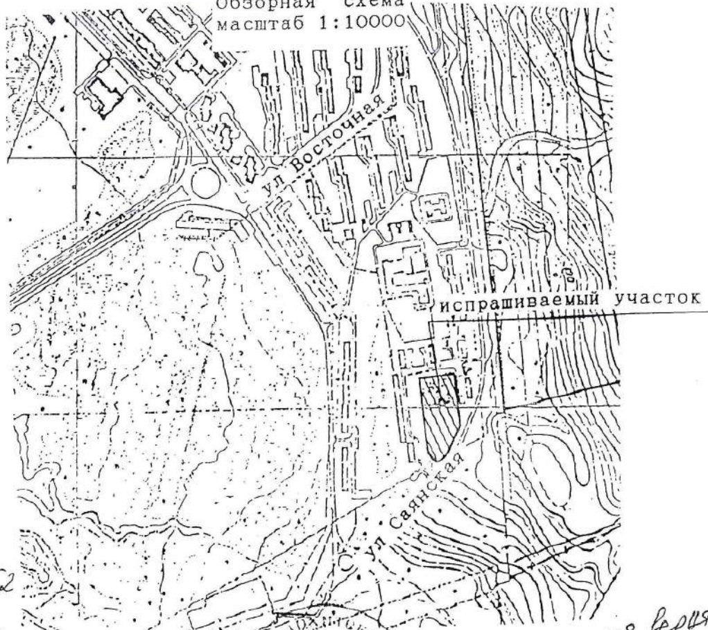
Обзорная схема масштаб 1:10000

ИТЕТ КО СМЕЛВАНИ РСАН И ЗЕМЛЕУСТ СЛЕЗ. ОТОСНА ЕГИСИРАГОСАТО N 5352